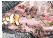
Hochgradiger Zahnstein bei einem Hund

Eine gesunde Maulhöhle ist für die allgemeine Gesundheit und das Wohlbefinden unserer Vierbeiner sehr wichtig, da es durch Absiedelung von Bakterien zu schwerwiegenden Schädigungen des Gesamtorganismus kommen kann. Nicht nur Lungen-, sondern auch chronische Herz-, Nieren- sowie Lebererkrankungen und Diabetes können die dann irreversiblen Folgen für den Patienten sein, welcher dann dauerhaft mit Medikamenten behandelt werden muss.